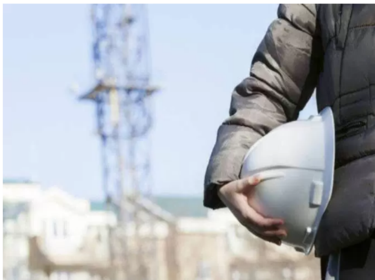
Construção: receitas e quadro de funcionários da Geosonda caíram pela metade entre o ano passado e este

São Paulo – A construtora Geosonda, especializada em fundações e rebaixamento de lençol freático, acaba de entrar em processo de recuperação judicial .