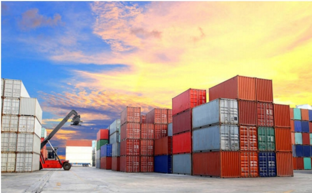
Contêineres: dívida da Granport já chega a R$ 130 milhões